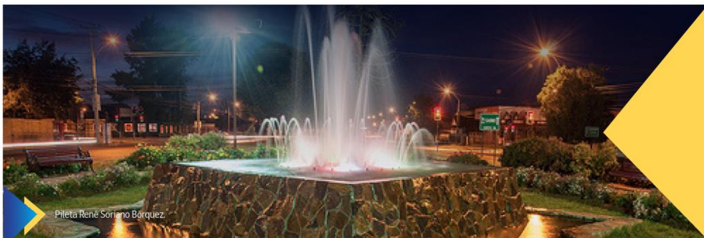
Pileta René Soriano Bórquez.