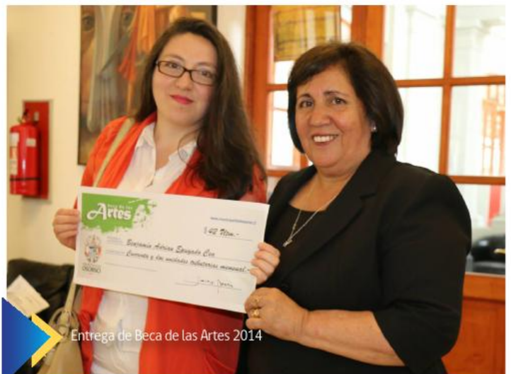
Entrega de Beca de las Artes 2014

Proyecto "Mejoramiento Sede Social y Áreas Verdes poblaciones Kolbe Alto y Madre Teresa de Calcuta", a cargo de la Junta de Vecinos N°22 de ese sector.