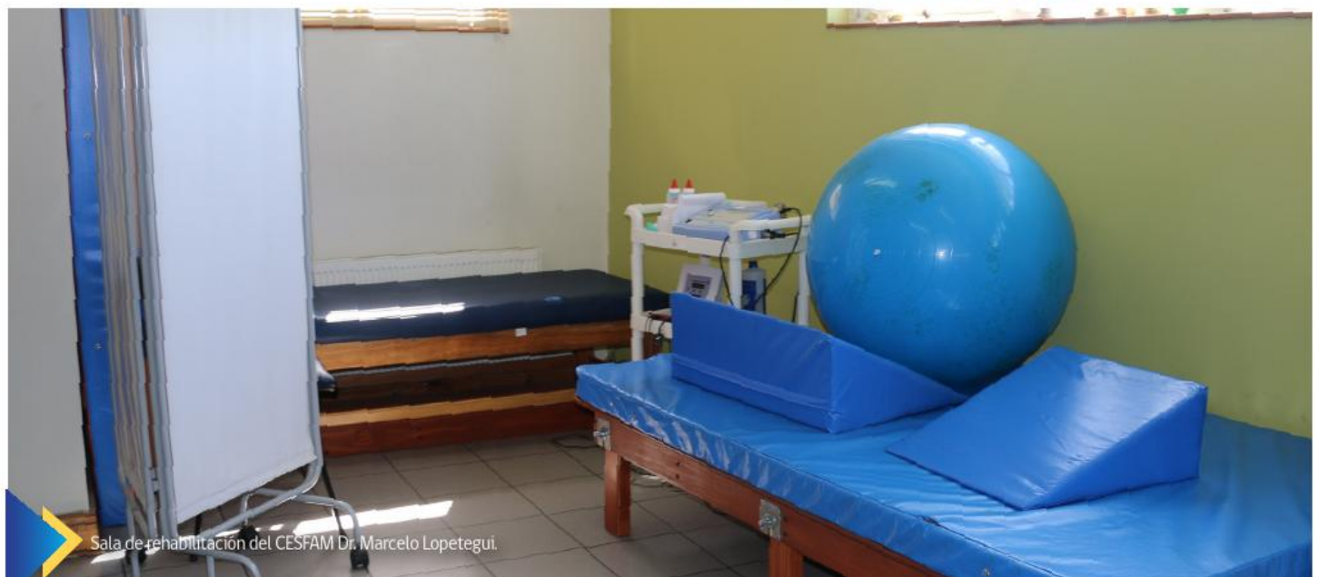
Sala de rehabilitación del CESFAM Dr. Marcelo Lopetegui.