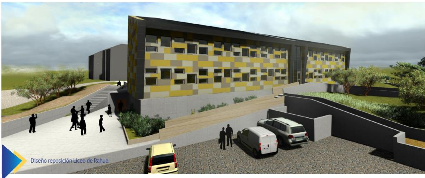
Diseño reposición Liceo de Rahue.