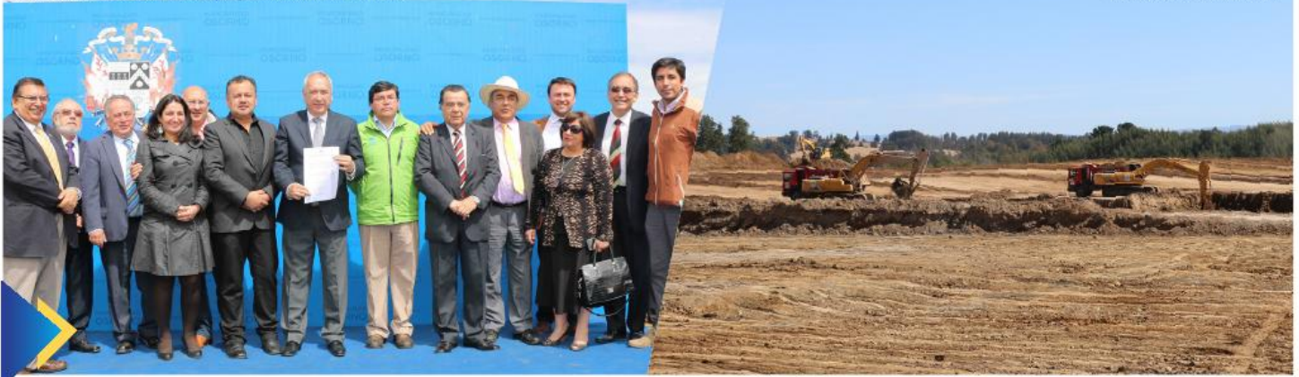
Obras Relleno Sanitario.