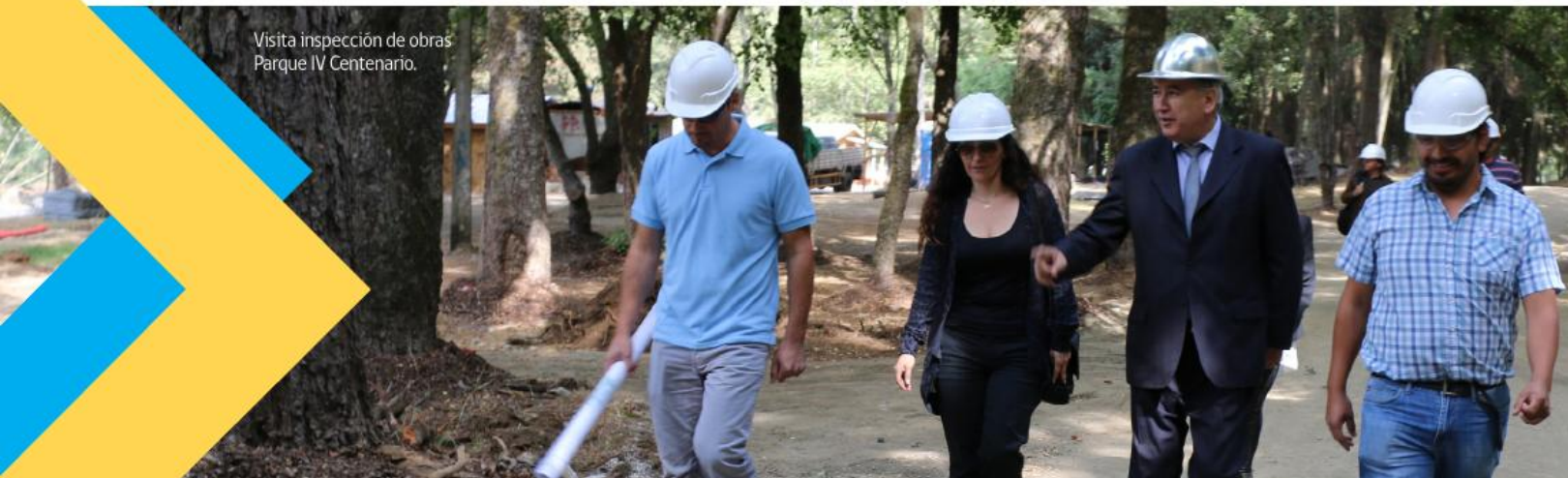
Visita inspección de obras Parque IV Centenario.