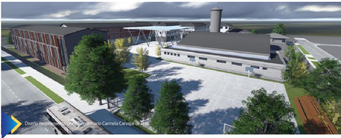
Diseño mejoramiento Liceo Bicentenario Carmela Carvajal de Prat.

Cabe destacar que el año 2014 similares proyectos de inversión se ejecutaron en las escuelas España, Italia, Juan Ricardo Sánchez, México, Monseñor Francisco Valdés y en el Liceo Industrial.