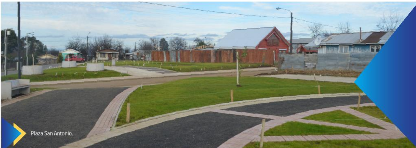
Plaza San Antonio.

Gracias al trabajo en conjunto con el Serviu, el municipio gestionó acciones hasta levantar este bello espacio público en un lugar que por mucho tiempo estuvo tomado, quedando en el recuerdo el ex campamento San Antonio, mejorándose sustancialmente la calidad de vida de quienes residen es este sector y su plusvalía.