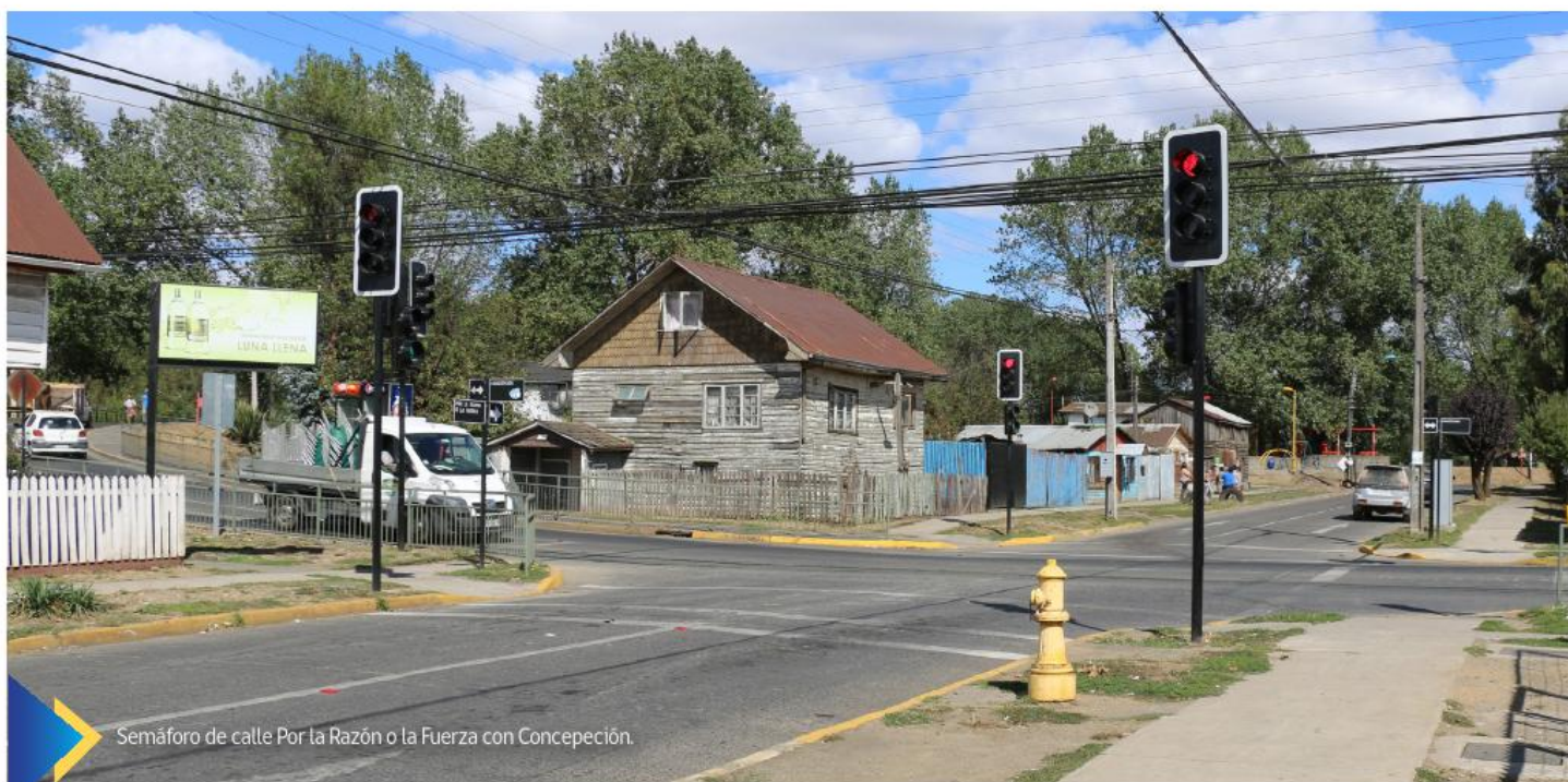
Semáforo de calle Por la Razón o la Fuerza con Concepción.

Equipamiento urbano que vino a resolver problema de inseguridad vial que se registraba por años en ambos lugares, y donde los accidentes vehiculares y atropellos se habían convertido en algo recurrente, dos proyectos que en su conjunto consideró una inversión de 75 millones de pesos, recursos provenientes de la Ley Espejo del Transantiago.