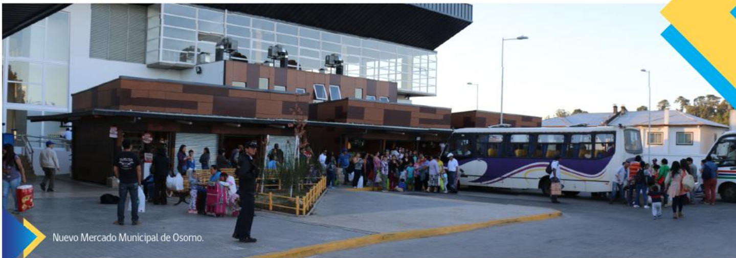
Nuevo Mercado Municipal de Osorno.