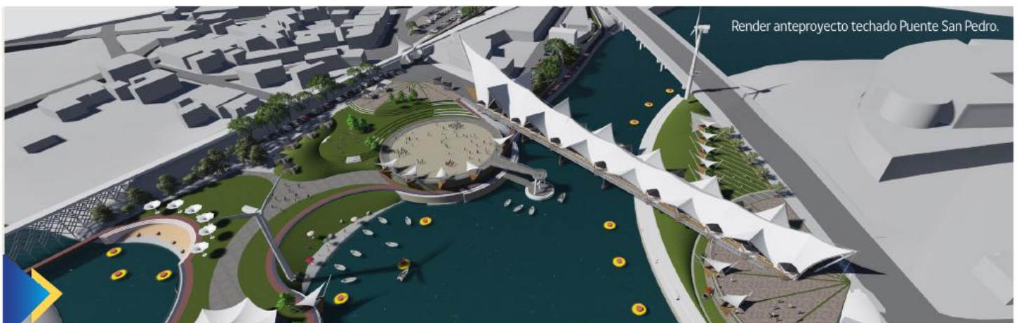
Render anteproyecto techado Puente San Pedro.

Este proyecto cumplió con todos los requerimientos legales establecidos en sus procesos de licitación y adjudicación, lo que significa que contó con la aprobación de todos los entes involucrados en su concreción tales como el Gobierno Regional de Los Lagos, el Core y el Ministerio de Desarrollo Social, además del visto bueno del Banco Alemán KfW que, a través de una gestión realizada por la Subdere, efectuó un préstamo al Estado chileno para poder garantizar la edificación de la obra.