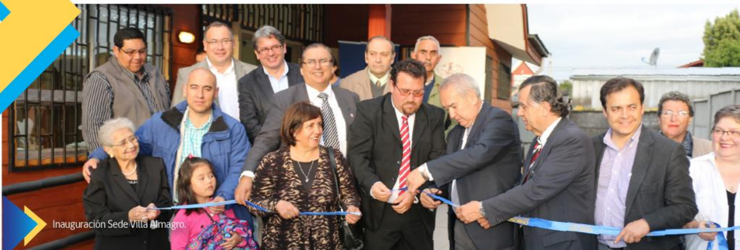
Inauguración Sede Villa Almagro.