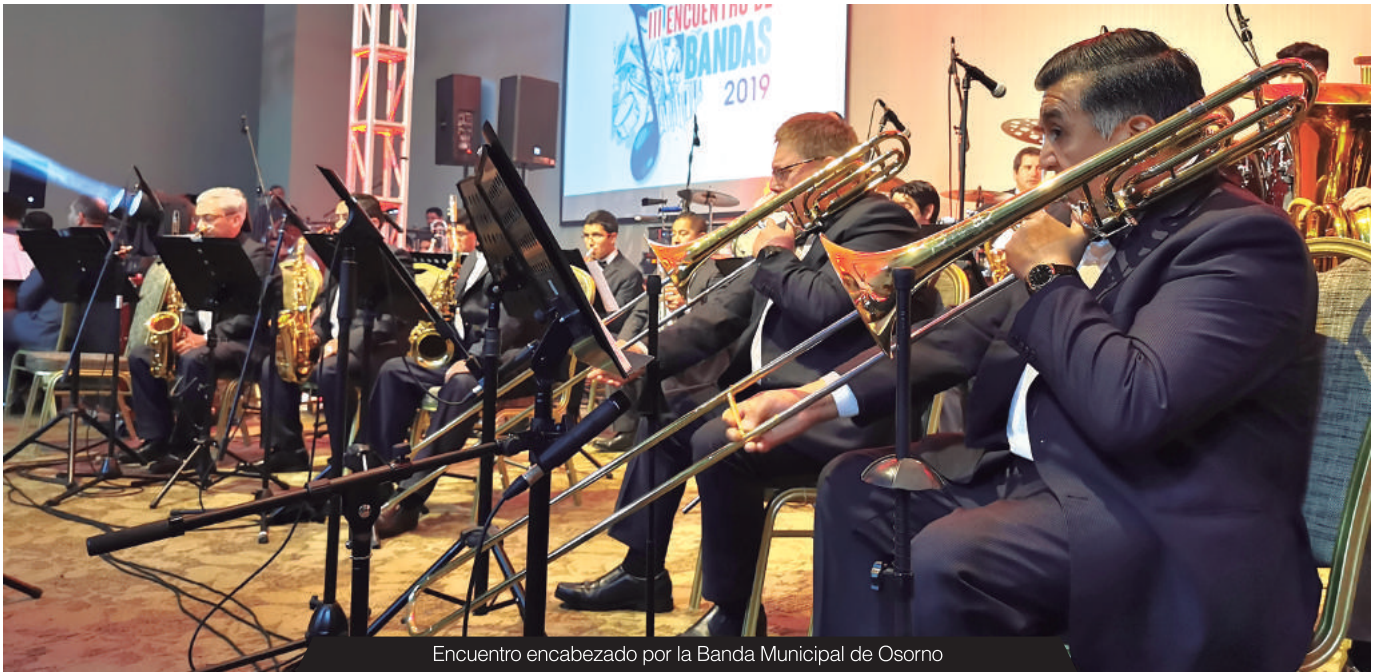
Encuentro encabezado por la Banda Municipal de Osorno