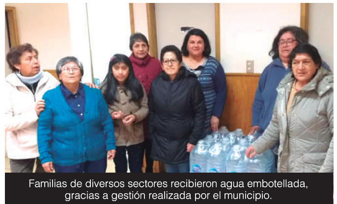
Familias de diversos sectores recibieron agua embotellada, gracias a gestión realizada por el municipio.