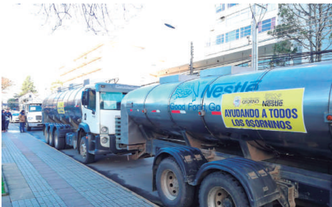
Gracias a gestión municipal, diversas empresas entregaron agua potable para suministro de la comunidad.