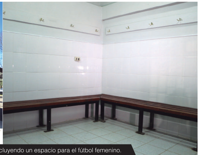
Esta obra contempló nuevos camarines, incluyendo un espacio para el fútbol femenino.