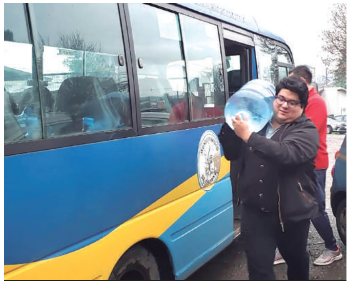
Las escuelas y liceos también contaron con agua purificada para sus alumnos.