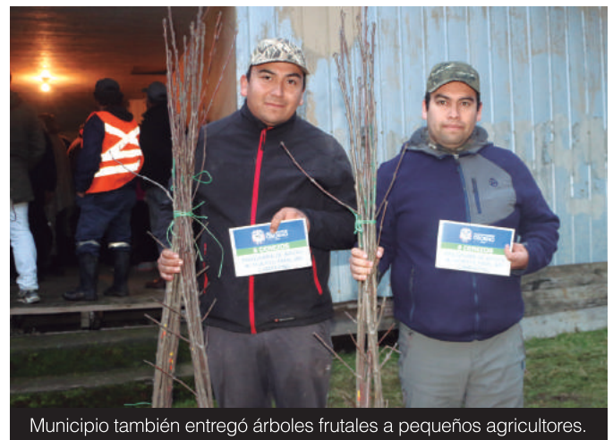
Municipio también entregó árboles frutales a pequeños agricultores.