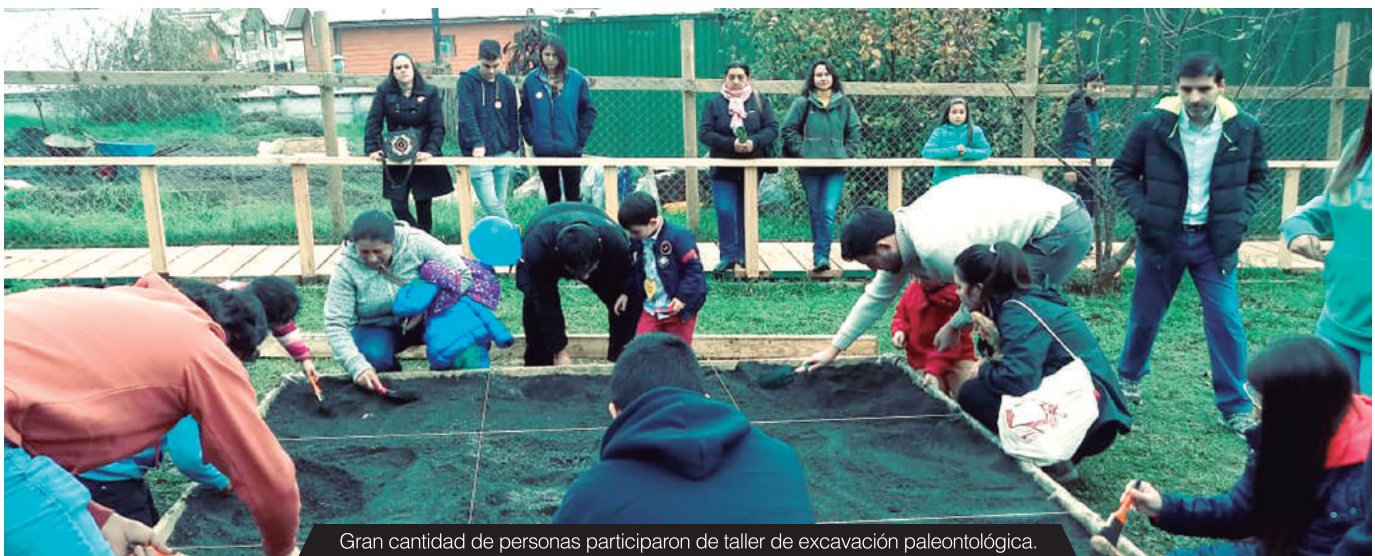
Gran cantidad de personas participaron de taller de excavación paleontológica.