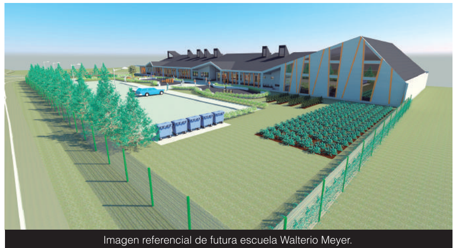
Imagen referencial de futura escuela Walterio Meyer.

Cabe destacar que, tras el siniestro registrado en este recinto, sus alumnos fueron reubicados en la Escuela España para proseguir con sus actividades lectivas, donde son trasladados, ida y vuelta, por el municipio.