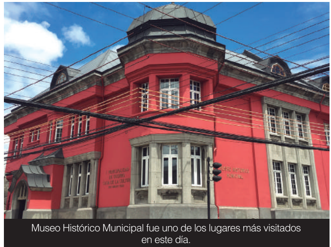
Museo Histórico Municipal fue uno de los lugares más visitados en este día.

A esta última actividad asistió una gran cantidad de familias con sus hijos, lo que demuestra que los niños sí tienen interés en aprender sobre el pasado paleo-arqueológico de Osorno, lo que es clave para poner en valor, a las futuras generaciones, todo el trabajo que se ha realizado en este lugar.