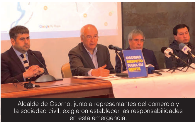
Alcalde de Osorno, junto a representantes del comercio y la sociedad civil, exigieron establecer las responsabilidades en esta emergencia.