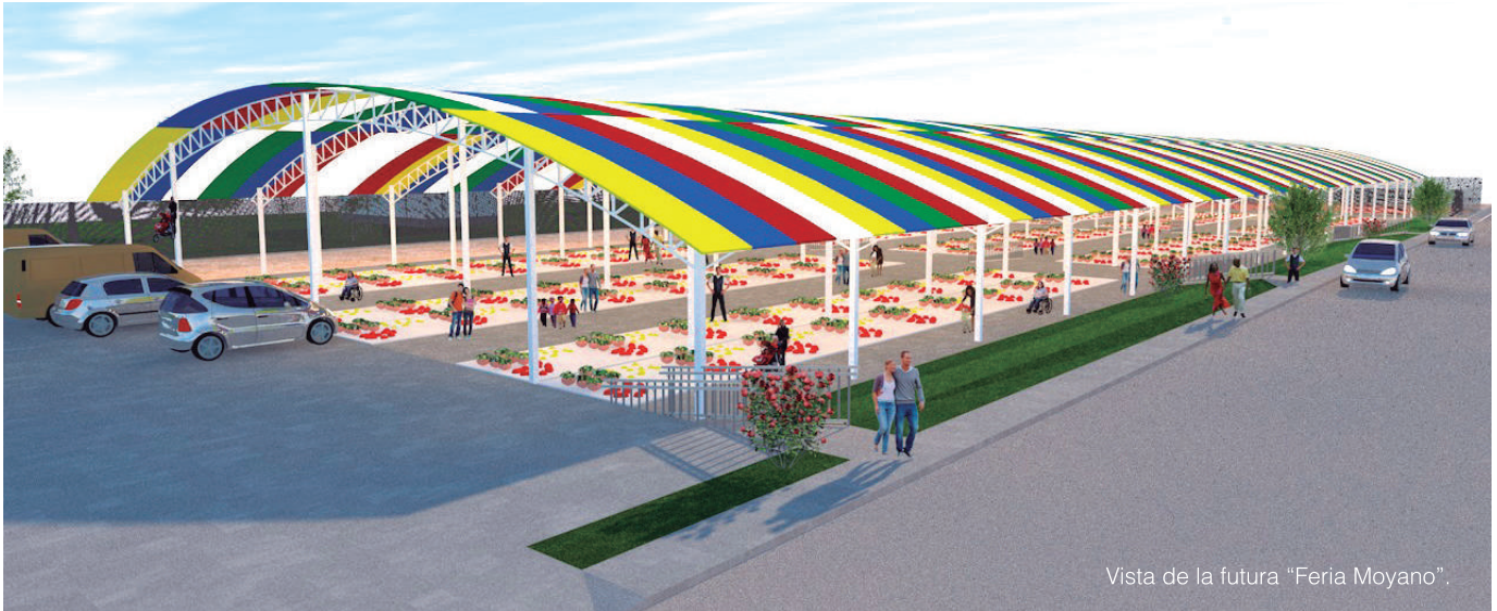
Vista de la futura "Feria Moyano".