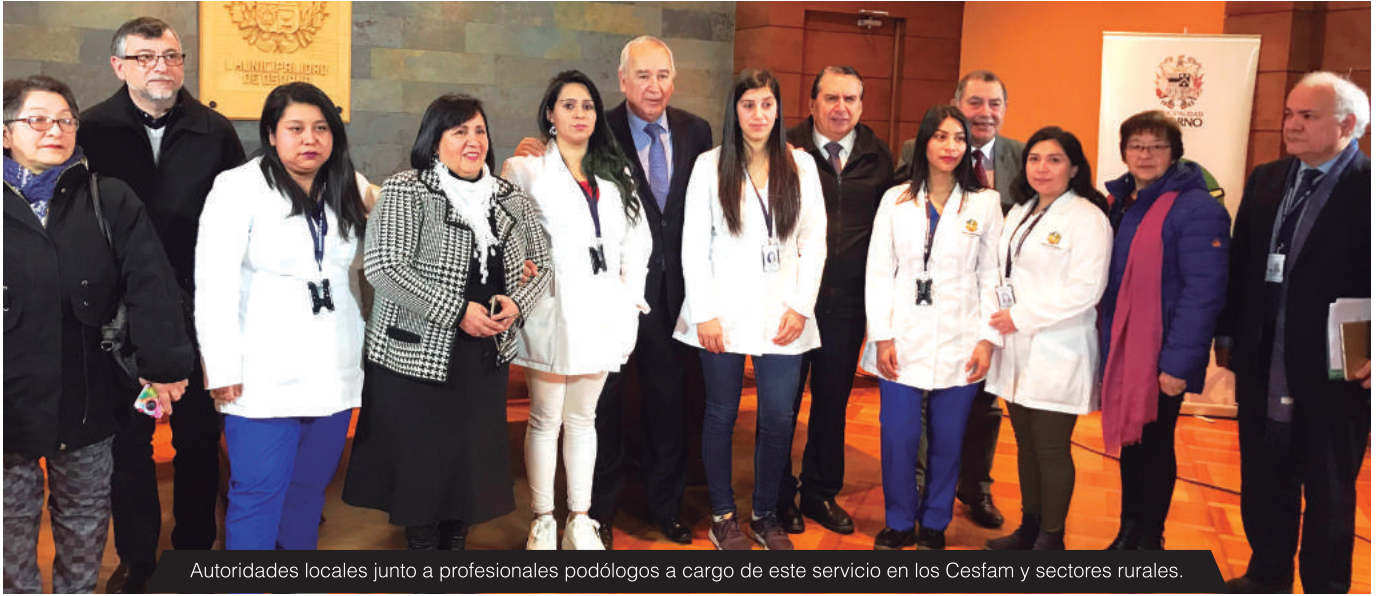
Autoridades locales junto a profesionales podólogos a cargo de este servicio en los Cesfam y sectores rurales.

U n servicio gratuito a adultos mayores y adultos mayores diabéticos que acuden a los Centros de Salud Familiar (CESFAM) y también a aquellos pacientes del sector rural, con un móvil de atención comunitaria, comenzó a brindar el municipio gracias al "Programa de Podología Clínica de Osorno".