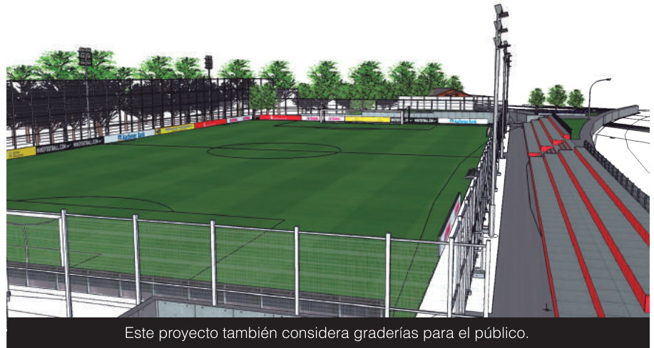
Este proyecto también considera graderías para el público.