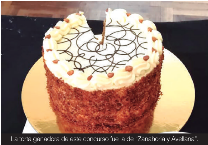
La torta ganadora de este concurso fue la de "Zanahoria y Avellana".

Este "Osorno Dulce" congregó a más de 80 concursantes de toda la provincia, que presentaron las más variadas tortas caseras, con una diversidad de colores, texturas, sabores y diseños.