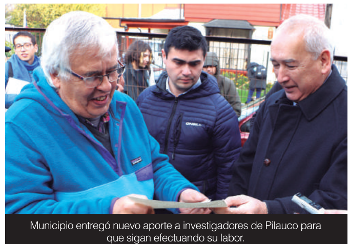
Municipio entregó nuevo aporte a investigadores de Pilauco para que sigan efectuando su labor.