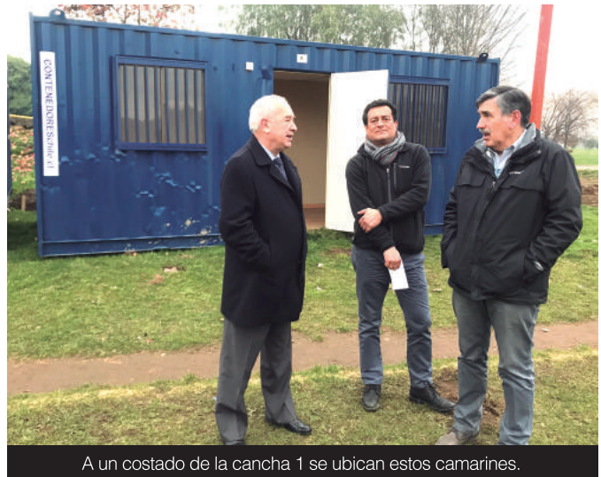
A un costado de la cancha 1 se ubican estos camarines.