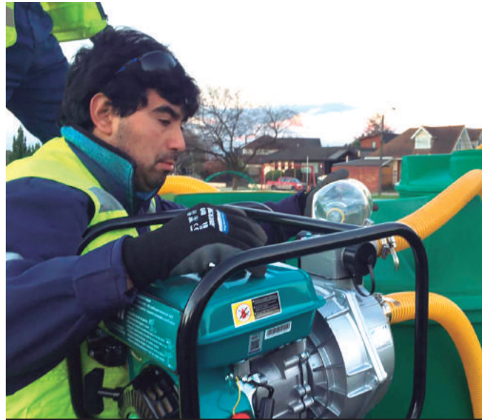
Personal municipal trabajó las 24 horas para abastecer los estanques de suministro de agua potable.