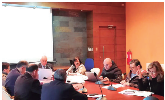
Concejo Municipal acordó oficiar a Presidente Sebastián Piñera para caducar concesión de empresa Essal en la ciudad.