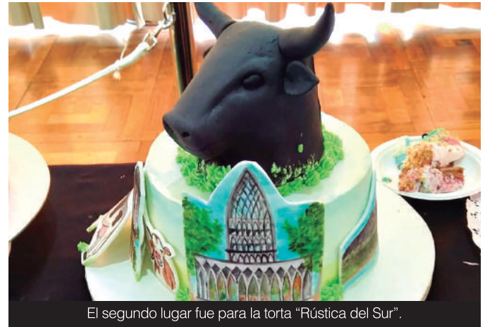
El segundo lugar fue para la torta "Rústica del Sur".