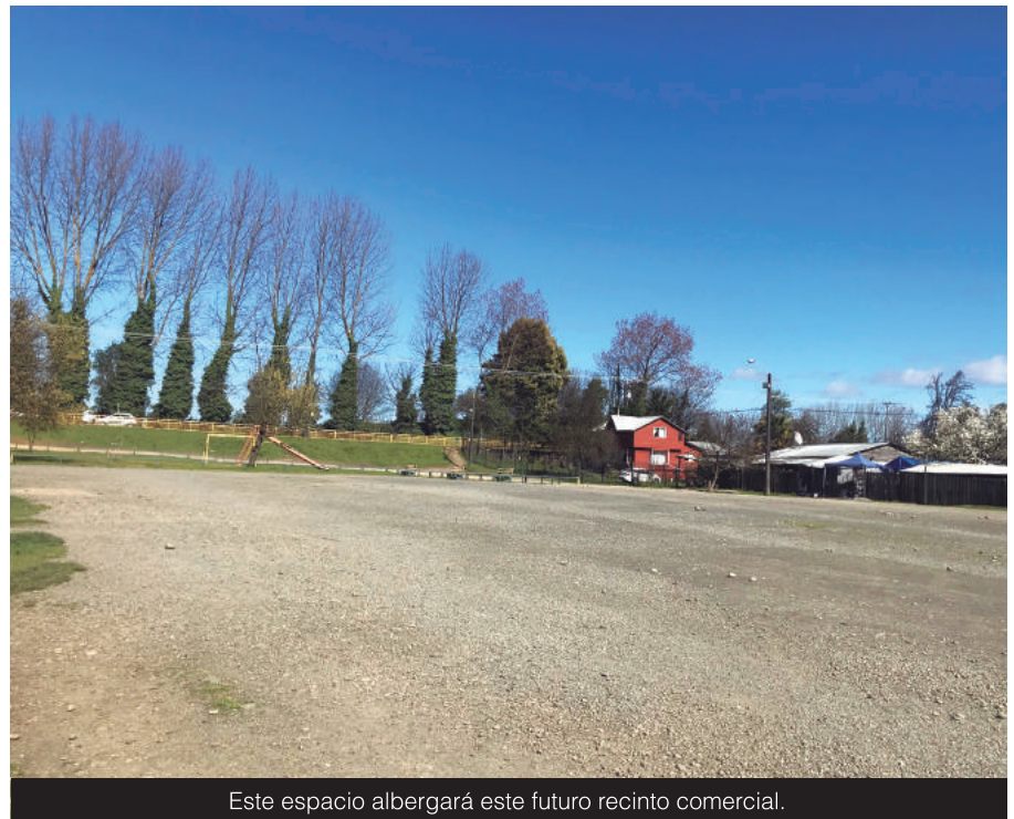
Este espacio albergará este futuro recinto comercial.

La empresa que ejecutará la obra corresponde a Constructora Pilauco, que tiene un plazo de 180 días para efectuar estas faenas.