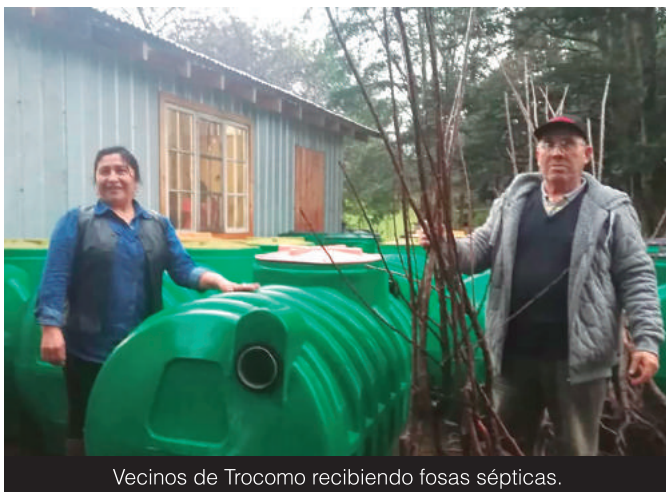
Vecinos de Trocomo recibiendo fosas sépticas.