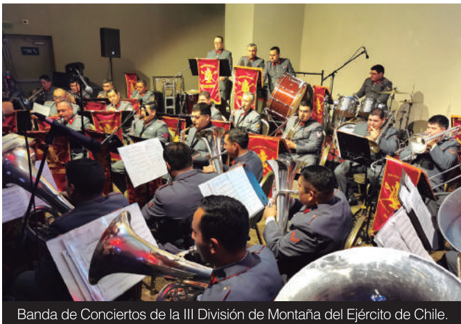
Banda de Conciertos de la III División de Montaña del Ejército de Chile.