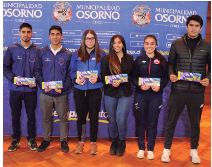
Imagen de los seis ganadores de esta beca municipal.