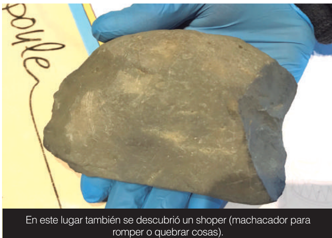
En este lugar también se descubrió un shoper (machacador para romper o quebrar cosas).

Cabe destacar que, junto a esta huella, fue encontrado un trozo de madera y un shoper (machacador para romper o quebrar cosas); elementos cuya data también superan los 14 mil años y, para continuar con todo este trabajo, y coincidiendo con este descubrimiento, el municipio de Osorno entregó un aporte de $40 millones de pesos al equipo investigativo del sitio Pilauco Bajo.