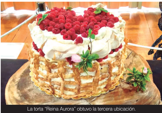
La torta "Reina Aurora" obtuvo la tercera ubicación.