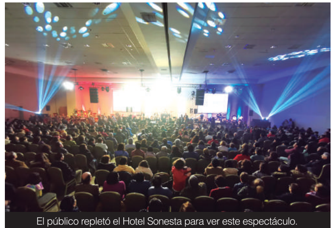
El público repletó el Hotel Sonesta para ver este espectáculo.