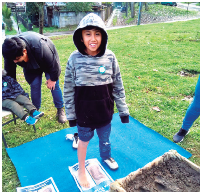
Los niños fueron los más entusiastas con esta celebración.