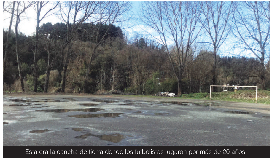
Esta era la cancha de tierra donde los futbolistas jugaron por más de 20 años.