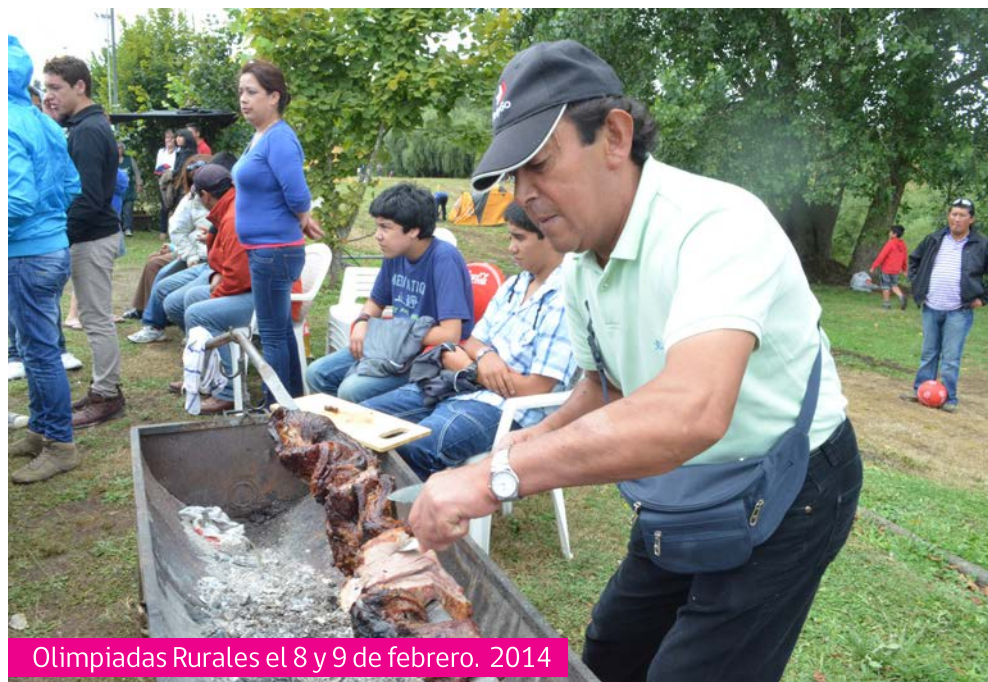
Olimpiadas Rurales el 8 y 9 de febrero, 2014

Además, hasta marzo de 2014 se puede disfrutar de la Piscina Municipal del Parque Chuyaca , la que cuenta con dos espejos de agua, pudiendo acoger cómodamente a cerca de mil personas, entre menores y adultos. El lugar considera cascadas y un tobogán, un total de 11 salvavidas, 2 paramédicos, 3 personas a cargo del acceso o control y 6 guardias que cumplen labores en forma permanente, en horario de 14:00 a 20:00 horas, de lunes a domingo, salvo el jueves que se realiza la mantención de la piscina.