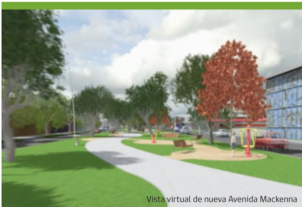
Vista virtual de nueva Avenida Mackenna

OSORNO CON 40 MIL MILLONES DE INVERSIÓN AÑO 2014